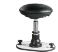
Beweglicher Gelenkhocker für Übungen im Sitzen